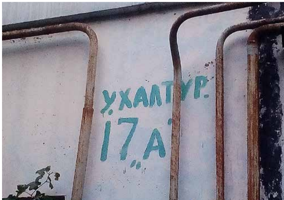
Театр начинается с вешалки, а любое здание — с адресного анилага на нём. При градоначальнике Андрее Ростенко утвердили солидные таблички на русском и английском языках, но, к сожалению, их установили не везде. А ведь это не сложно сделать!