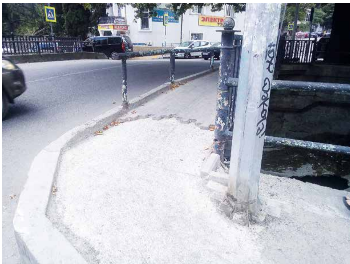
Улица Ломоносова. Напротив дома 31 у мостика после потопа летом 2021 года снесло плитку, которую так и не восстановили. А в самой речке снова нанесло очень много мусора. Коль не справляется ДЖКХ, может, стоит организовать оплачиваемые общественные работы?