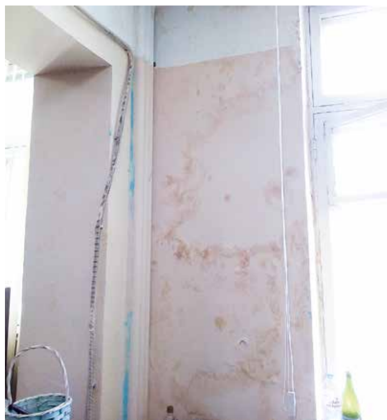
Горадминистрация Ялты. Вот в таких условиях (буквально дыша плесенью от протекающего потолка!) работают сотрудники управления внутренней политики. На днях здесь стали менять рамы: грохот, грязь, но почему-то людей не перевели в другой кабинет на время ремонта...