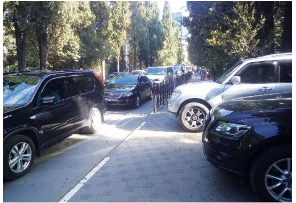
Улица Боткинская. Скоро дети пойдут в школу №6, лавируя между паркующимися прямо на тротуаре автомобилями. Как помочь водителям удобно и быстро припарковать своих «железных коней»? Увы, никто из властей не даёт ответа.