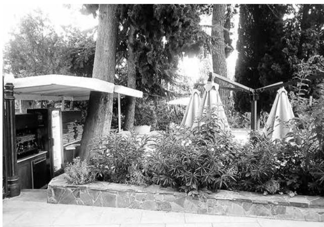
Заборы ныне окружают общедоступный в советское время скверик во дворе курортной поликлиники, а на месте Доски почёта терсовета появился бассейн