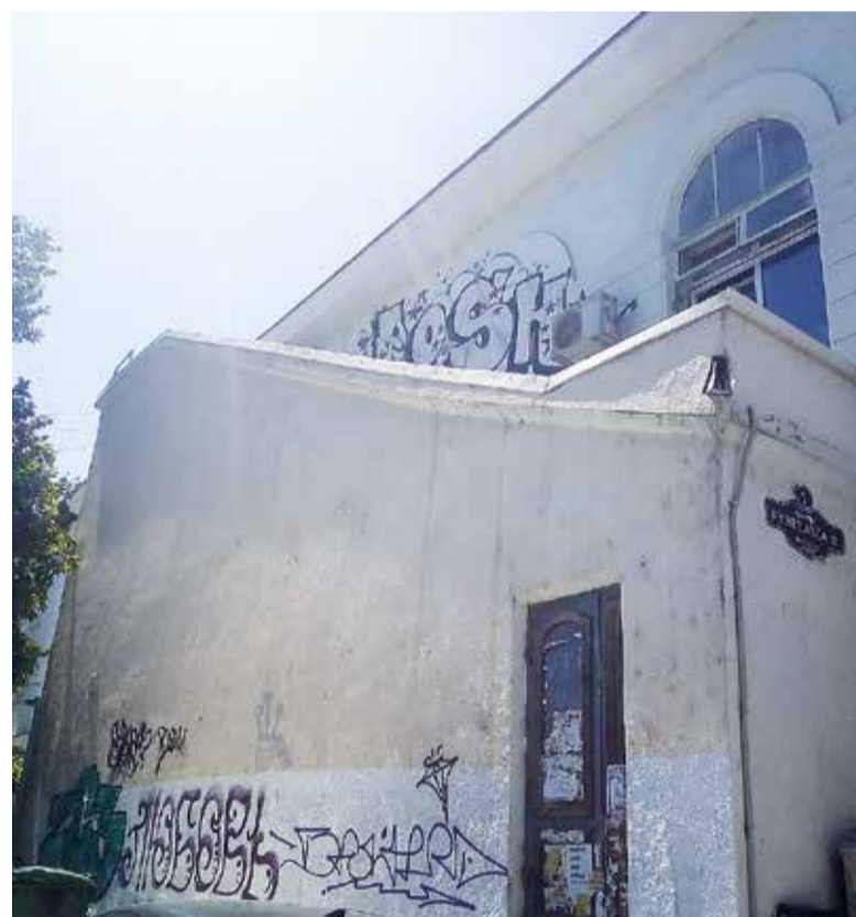
Многострадальный клуб моряков! До революции здесь была городская дума Ялты и даже хотели нынешний горсовет переселить в историческое здание.

Увы, республиканские власти до сих пор не нашли покупателя, который бы привёл в порядок некогда ухоженный объект культурного наследия.