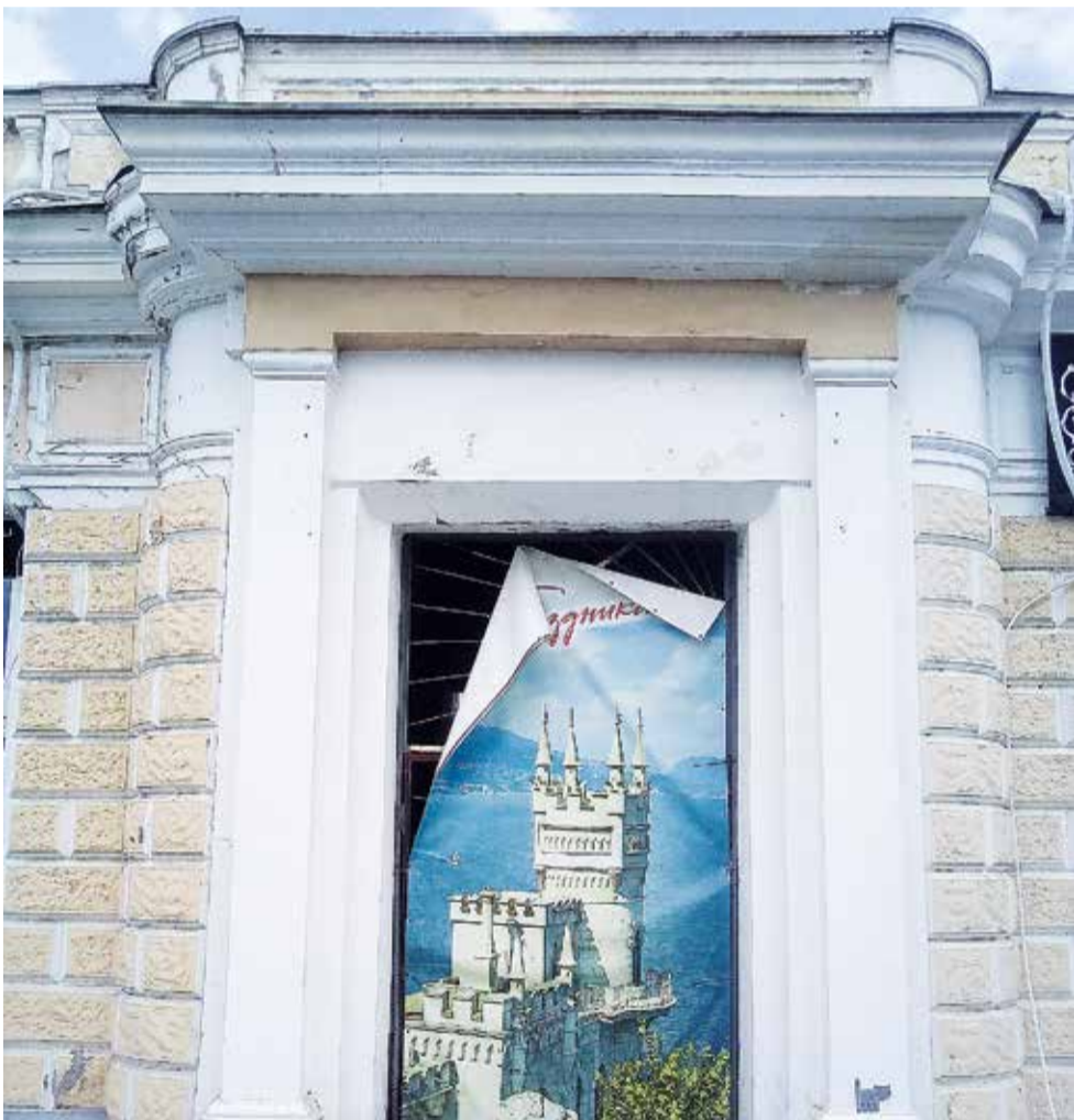
Набережная. В 1875 году построена гостиница «Россия» (нынешняя «Таврида») усилиями «общества для содействия к распространению удобств жизни в городе Ялте». Эх, когда же облагородят это место и откроют мраморную лестницу?