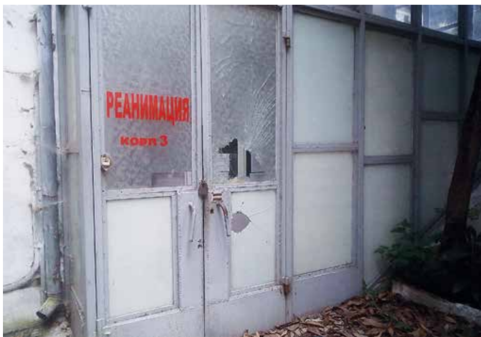
Когда-то в профсоюзный санаторий «Горняк» переехала детская больница. Сегодня здесь многие корпуса заброшены, а детей лечат в Ливадийской больнице. Безусловно, республиканским и городским властям надо сообща решать, что же делать с полуразбитыми зданиями.

Увы, республиканские власти до сих пор не нашли покупателя, который бы привёл в порядок некогда ухоженный объект культурного наследия.