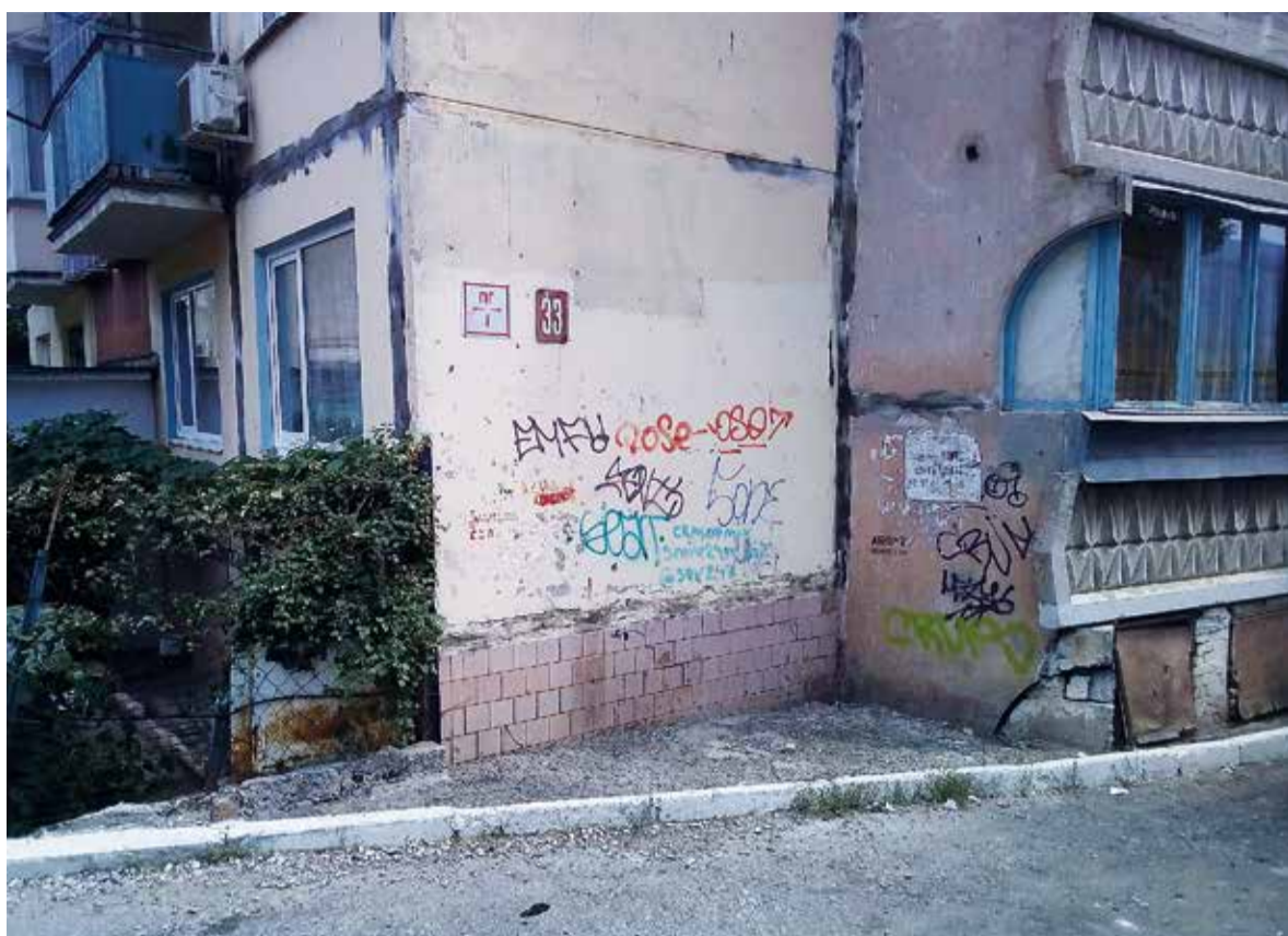
Улица Халтурина, дом 33. Вся Ялта изрисована «граффити», но департамент муниципального контроля этого не замечает и не делает никаких предписаний управляющим компаниям. А вот в продвинутых городах общественные пространства украшают художники.