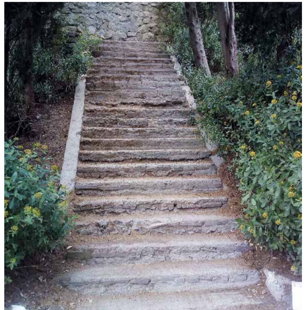
Дарсан. Холм Славы. В украинское время власти щедро раздавали земельные участки, которые «подобрались» буквально к подножию мемориала. А вот отремонтировать лестницу от канатной дороги не могут до сих пор... Позор!